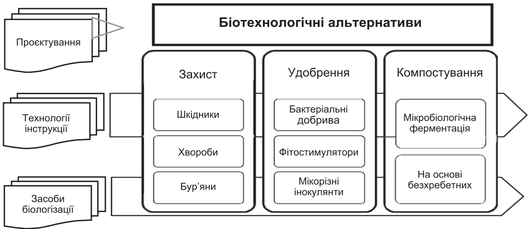
Рис. 2. Функціональна схема комплексу базових біотехнологічних альтернатив

ферментації та культивування безхребетних; застосування ентомологічних і мікробіологічних препаратів захисту рослин від шкідників, хвороб, бур'янів; застосування біологічних препаратів для підвищення родючості ґрунту.