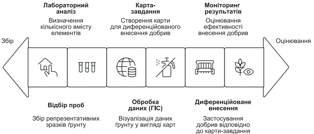
Рис. 1. Схема процесу агрохімічного моніторингу (розробка авторів)

Після збору даних головне завдання — перетворити їх на корисну інформацію для управління господарством. Для створення агрохімічних карт, карт потреб у добривах і візуалізацій, які показують часові зміни концентрації поживних речовин, використовують автоматизовані системи та ГІС. Хмарні платформи централізують лабораторні результати для перегляду в режимі реального часу та співпраці між заінтересованими сторонами. Оброблена інформація дає змогу оцінювати ключові показники здоров'я ґрунту (нітрати, фосфати, калій, вологість, органічний вуглець) й ухвалювати обґрунтовані рішення щодо внесення добрив, управління зрошенням, заходів захисту